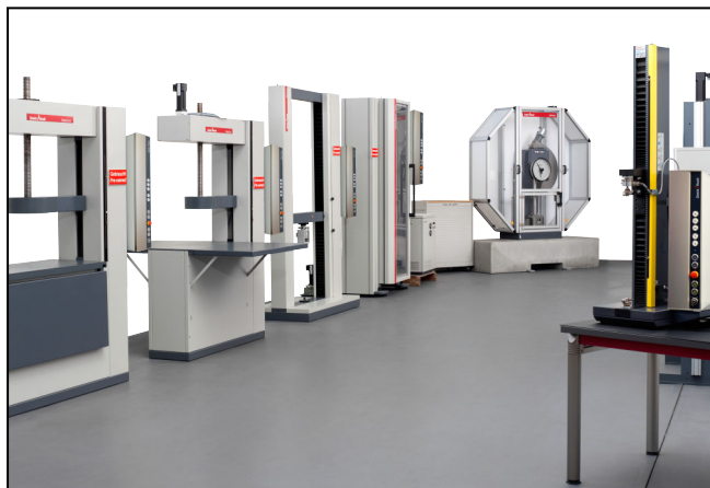
Die große Auswahl an gebrauchten Prüfmaschinen und Geräten